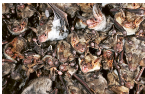
In Gams lebt eine seltene Mischkolonie der beiden Arten Grosse und Kleines Mausohr.

Organisiert von der Katholischen Kirche Gams und dem Verein Fledermausschutz St. Gallen-Apenzell-Liechtenstein.