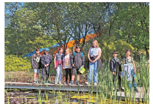
Mini-Ausflug in den Skyline-Park im Allgäu

Die Ministranten der Antoniuspfarre erlebten am 9. Mai mit vielen anderen Minis der Seelsorgeeinheit einen aufregenden Ausflug in den Skyline-Park im Allgäu. Der Tag war bei toller Stimmung voller Spiel und Spass und schöner Gemeinschaft. Eine gute Gelegenheit für die Pfarrei, sich einmal mehr bei den Minis für ihren wertvollen Einsatz am Altar zu bedanken.