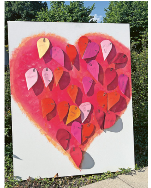
Erinnerung an die Erstkommunion

Silvia Dietschi Seidenbaum 5 | 9477 Trübbach 078 683 64 77 silvia.dietschi@kathwerdenberg.ch