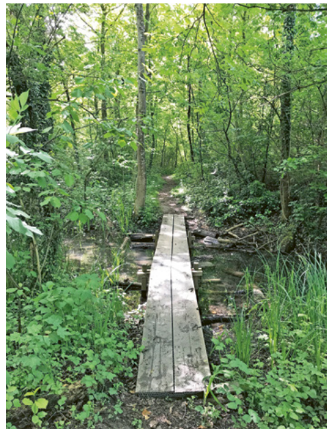
Morgenmeditation im Heuwiesenwald

Anmeldung: Bitte bis um 18 Uhr des jeweiligen Vorabends via WhatsApp an Viviane Auer, 078 865 48 96. – Vielen Dank!