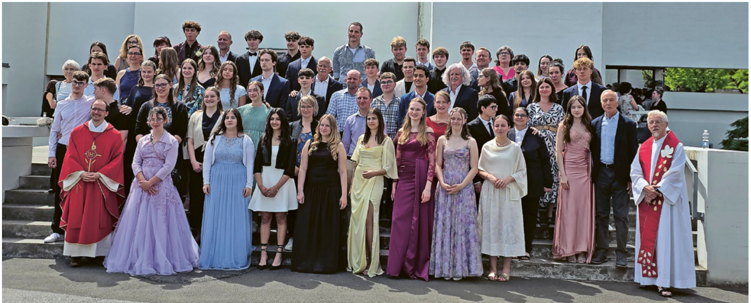
Firmung in Buchs