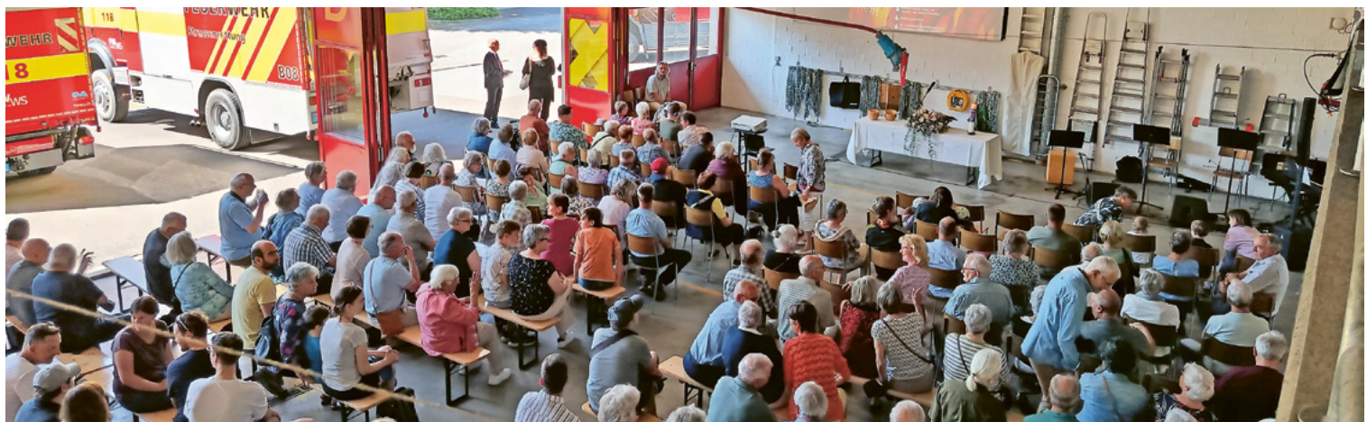
Ökum. Pfingstgottesdienst «Feuer und Flamme» im Feuerwehrdepot