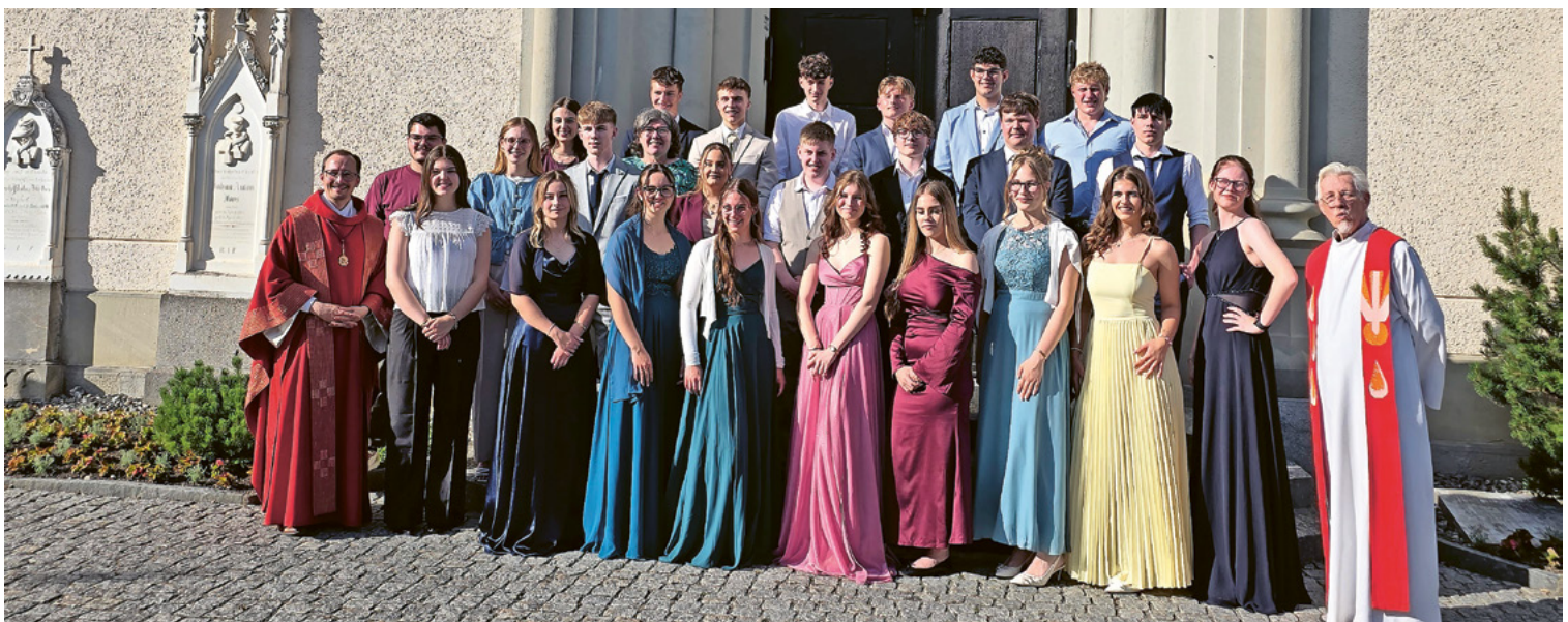
Firmung in Gams