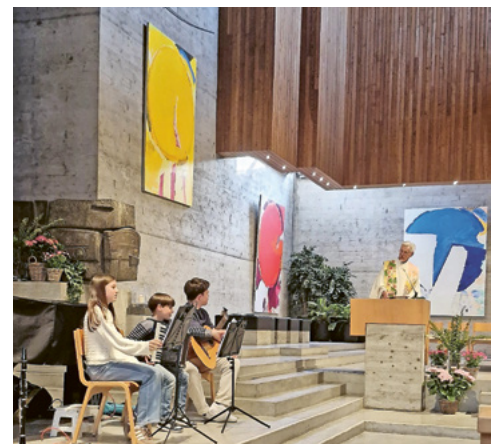
Die Werdenberger Musikanten im Paargottesdienst