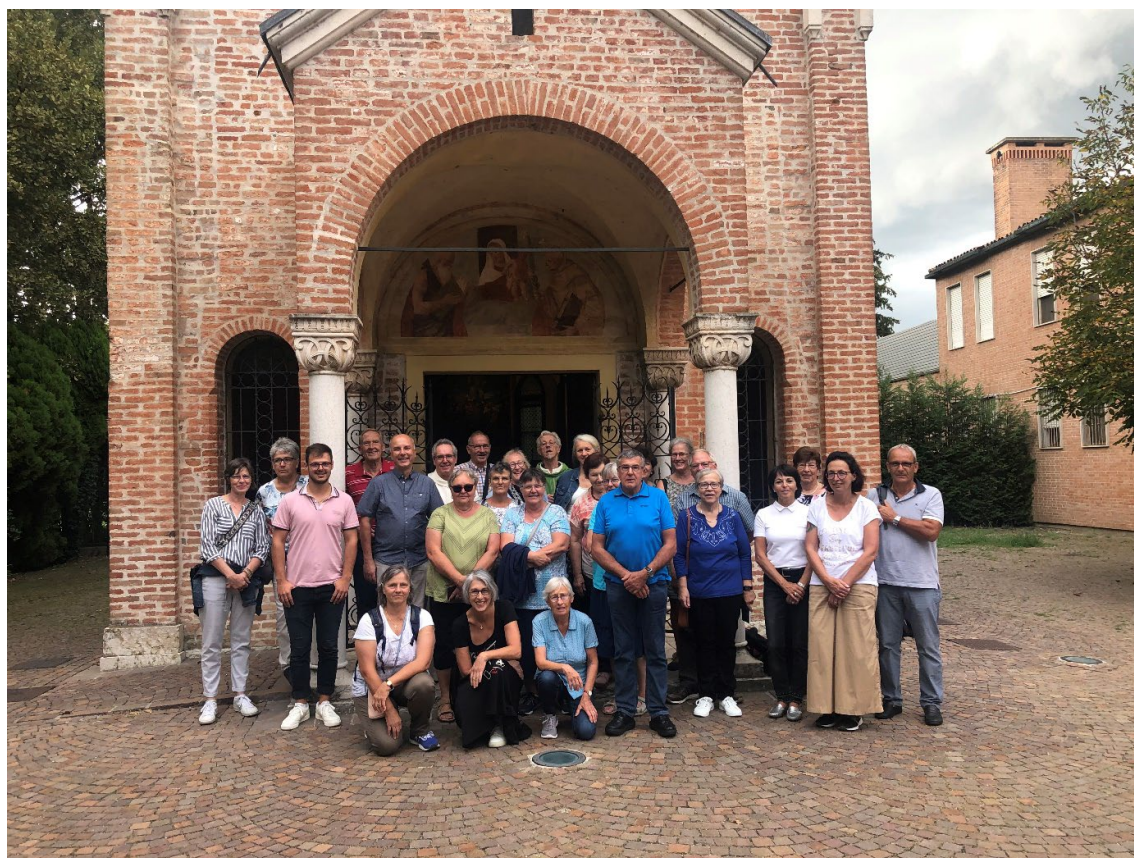
Foto: Pilgergruppe unserer Kirchengemeinde vor der Nusskapelle in Camposampiero, Italien