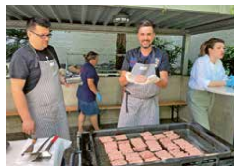
Die kroatische Mission brätelte Cevapcici