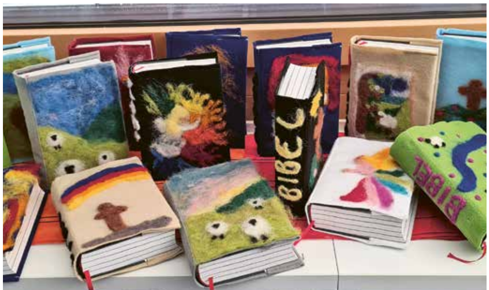
Die Bibel zum eigenen Unikat machen, so richtig stolz darauf sein und Freude daran haben.