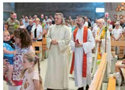
Festgottesdienst mit italienischer und kroatischer Mission