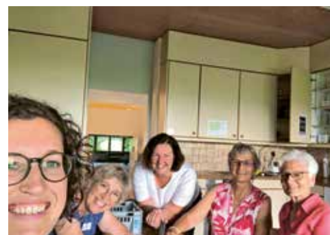
Helferinnen im Hintergrund