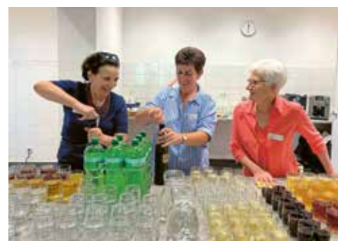
Getränkeauschank im Office