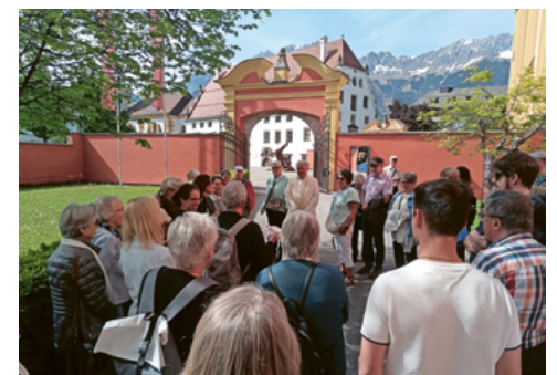
Pfarreiausflug Innsbruck, Stift Wilten