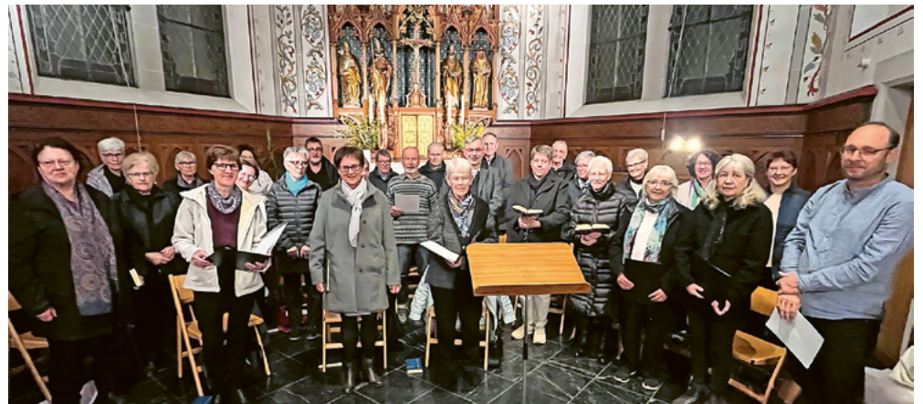
Ökumenischer Kirchenchor Wartau – letzter Auftritt