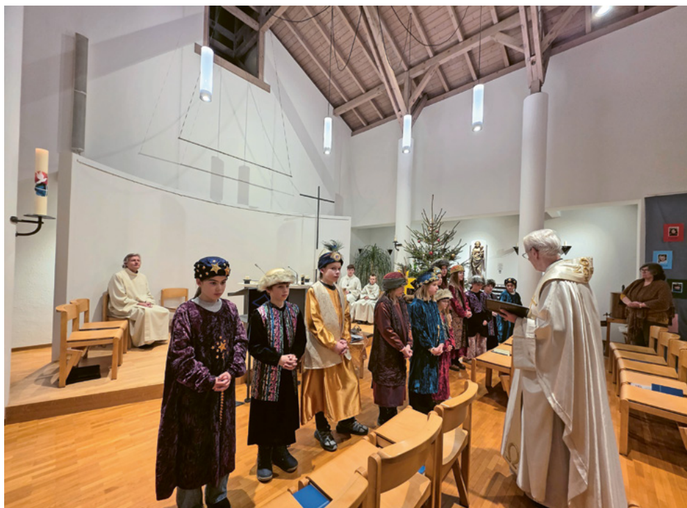
Aussendung der Sternsinger

Der Herr schenke ihnen Licht und Freude bei IHM, den Angehörigen und Freunden Trost und Kraft.