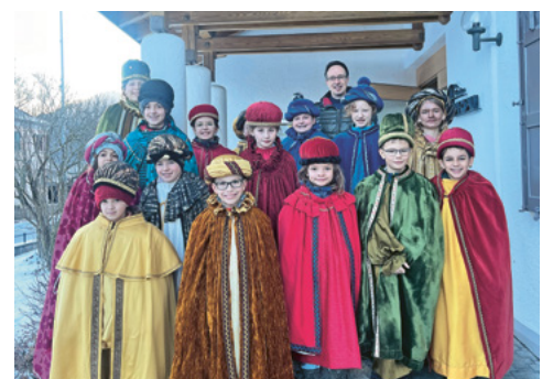
Sternsinger unterwegs im Wartau