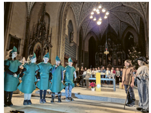
Krippenspiel «Oh Tannenbaum»