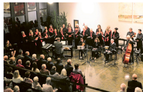
Adventskonzert von anTONis und evang. Kirchenchor Sennwald