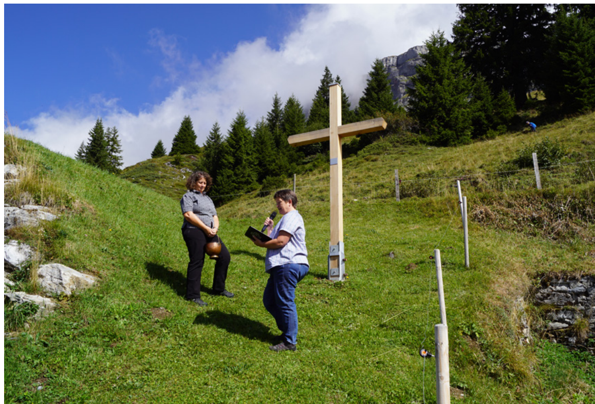
Alpgottesdienst mit Alpkreuzsegnung auf Alp Naraus, Flims