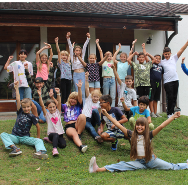
Schulstart 4./5. und 6. Klasse