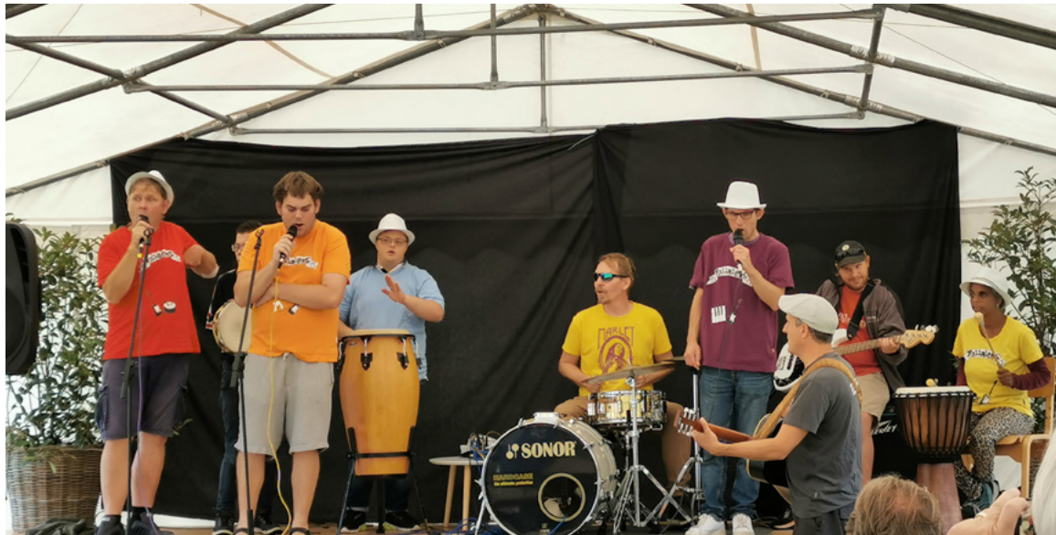
Begegnungen im Zelt – Lukashausbund Fallalens