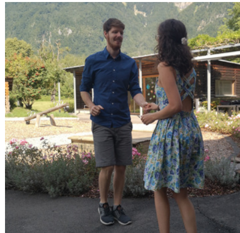
Sommertagesdienst im Altersheim – Sogar das Tanzbein durfte geschwungen werden.

Pfarrsekretariat | s. Pfarramt Gams | 081 771 11 44 | Öffnungszeiten: Mo–Fr 08:30–11:00 www.kathwerdenberg.ch/sennwald