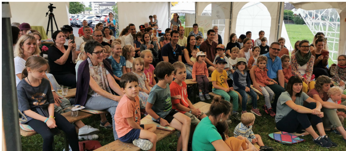
Begegnungen im Zelt