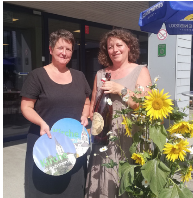
Gottesdienst am Dorffest