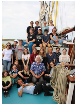
Segeltörn der Jugendlichen