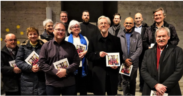
Eröffnung Jubiläumsjahr, Übergabe der Festschrift