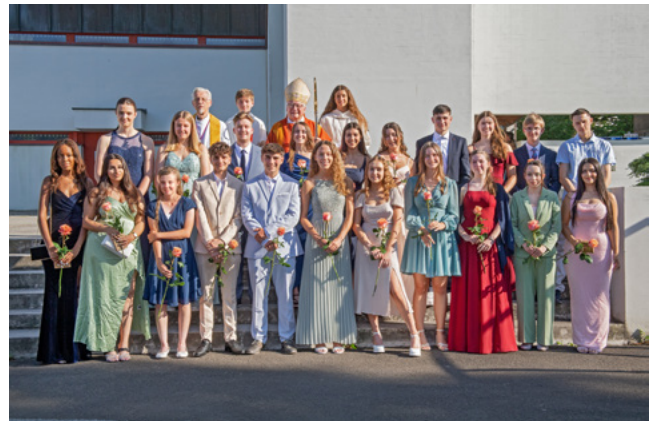
Firmung in Buchs mit Bischof Markus